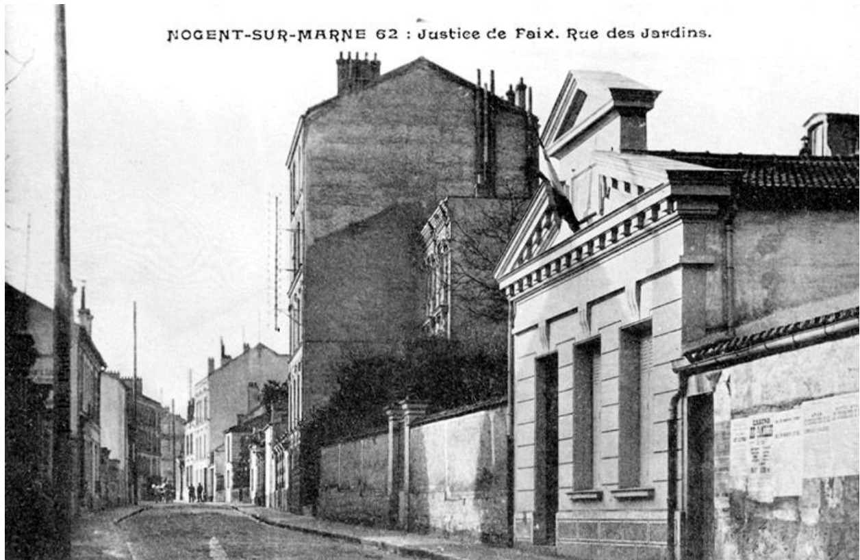
Vue de situation. Carte postale.