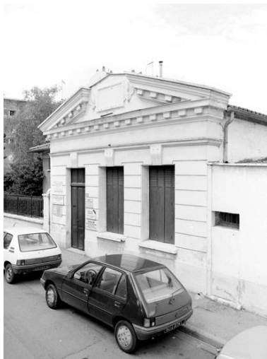
Face antérieure. IVR11_19869400303X