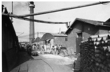
Les sheds et la cheminée.