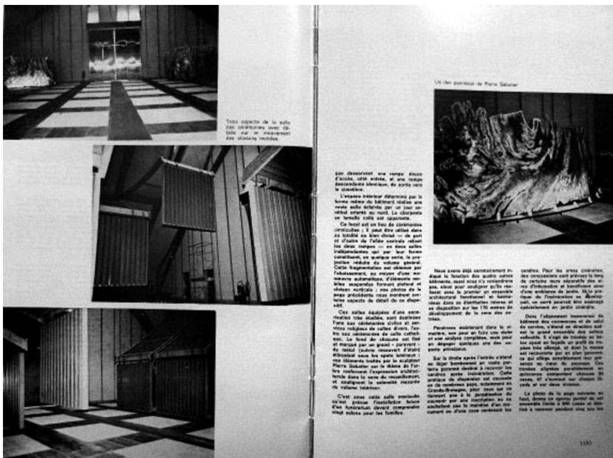
Trois aspects de la salle des cérémonies avec détail sur le mouvement des éléments mobiles

qui descendent une rampe douce d'accès, côté est, et une rampe ascendante identique, de sortie vers le jardin.