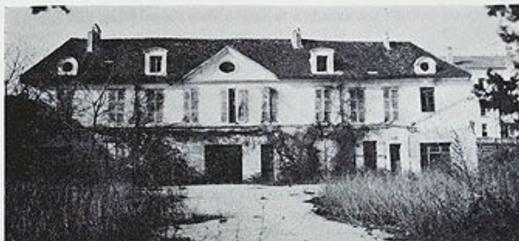
Fig. 1. — Façade Est de la Grande Maison : état actuel