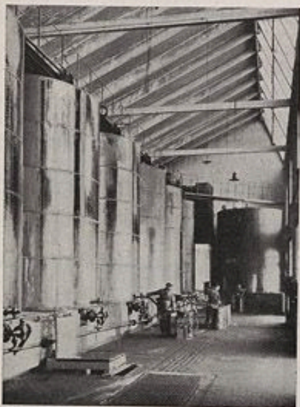
Ci-dessus, au Magasin Général de Villeneuve-Prairie, les cuves contenant les huiles à répartir dans les barils de chaque gare, dépôt ou atelier.

par M. Arnoux, Ingénieur Chef de la Division des Magasins