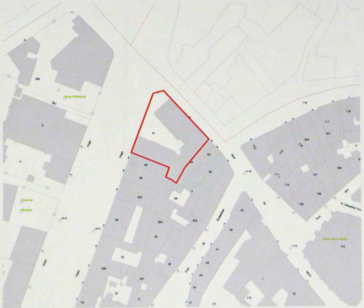
Pl. Plan masse, extrait du cadastre numérisé, Section AT, parcelle 41 échelle 1/1000e Alexandre Gourdel, 2004