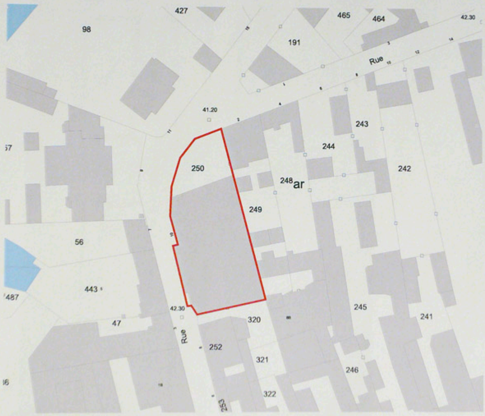
Pl. Plan masse, extrait du cadastre numérisé, Section AR, parcelle 250 échelle 1/1000e Alexandre Gourdel, 2004