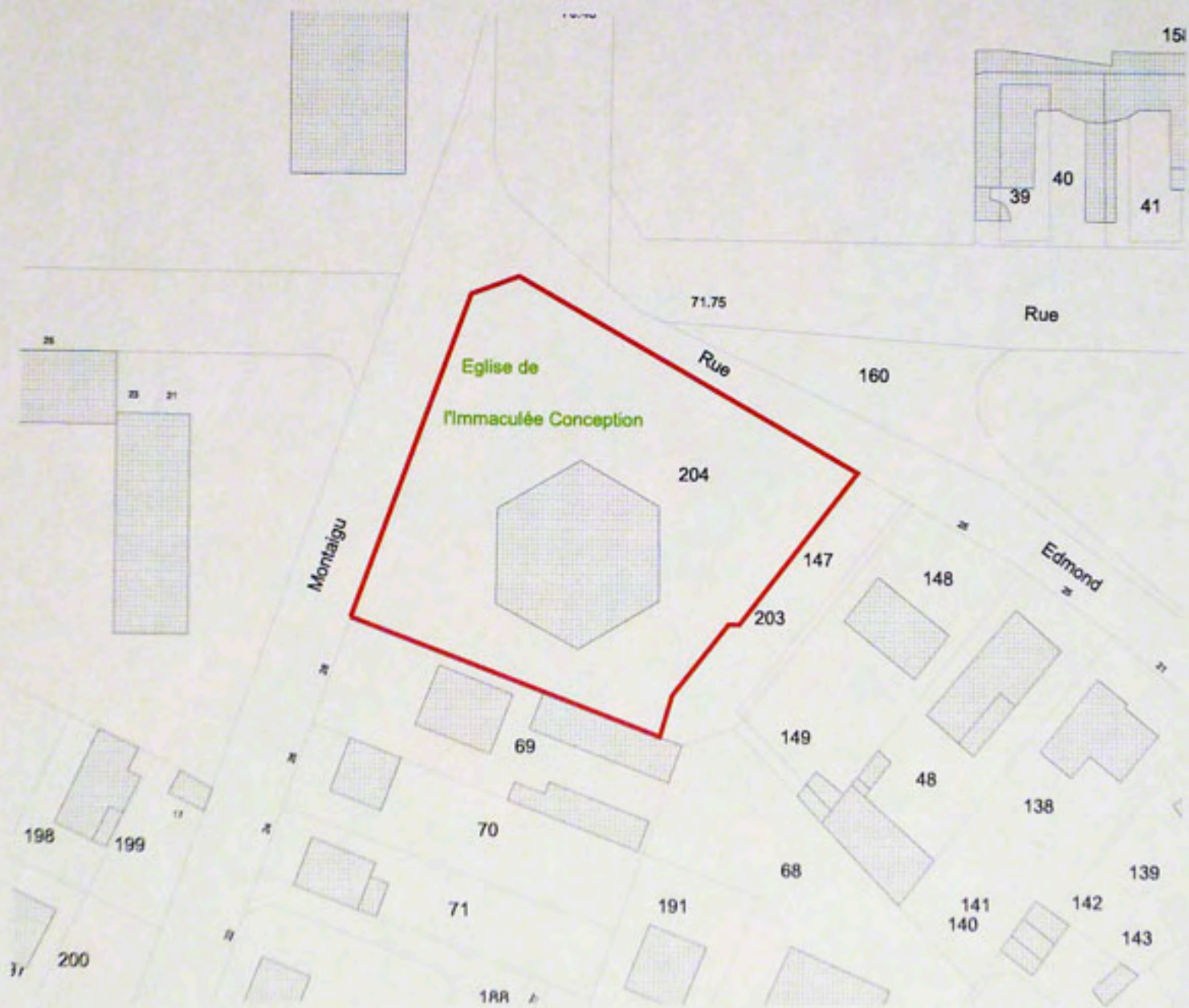
Pl. Plan masse, extrait du cadastre numérisé, Section AD, parcelle 204 échelle 1/1000e Alexandre Gourdel, 2004