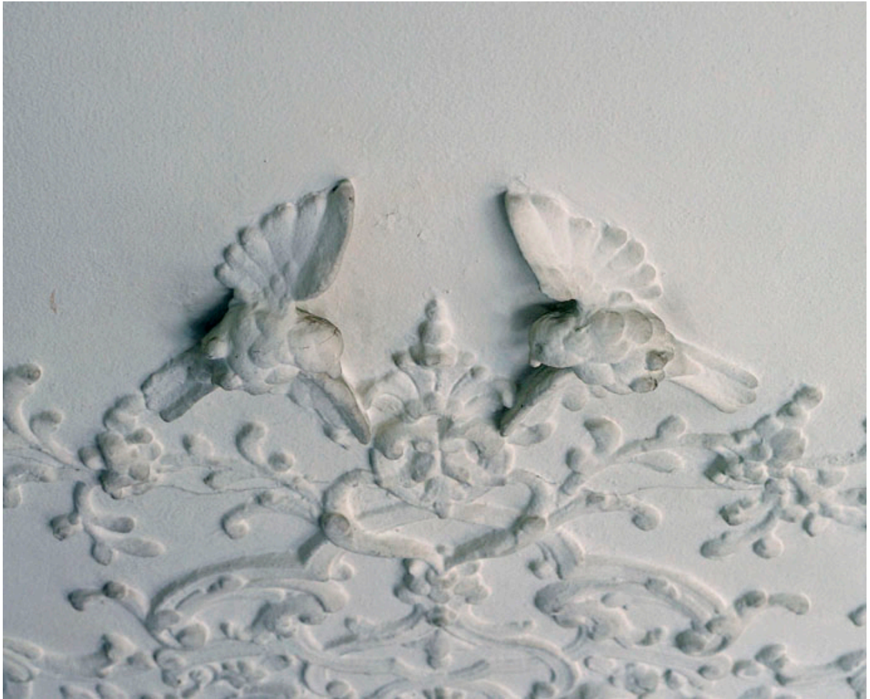
Décor de stuc ornant le milieu du plafond : détail de deux oiseaux volant.