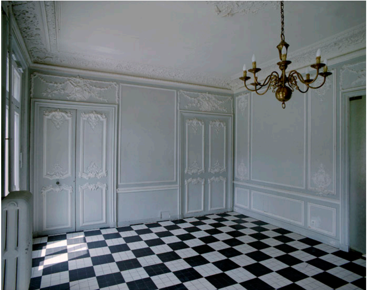
Vue intérieure du grand salon sur jardin.