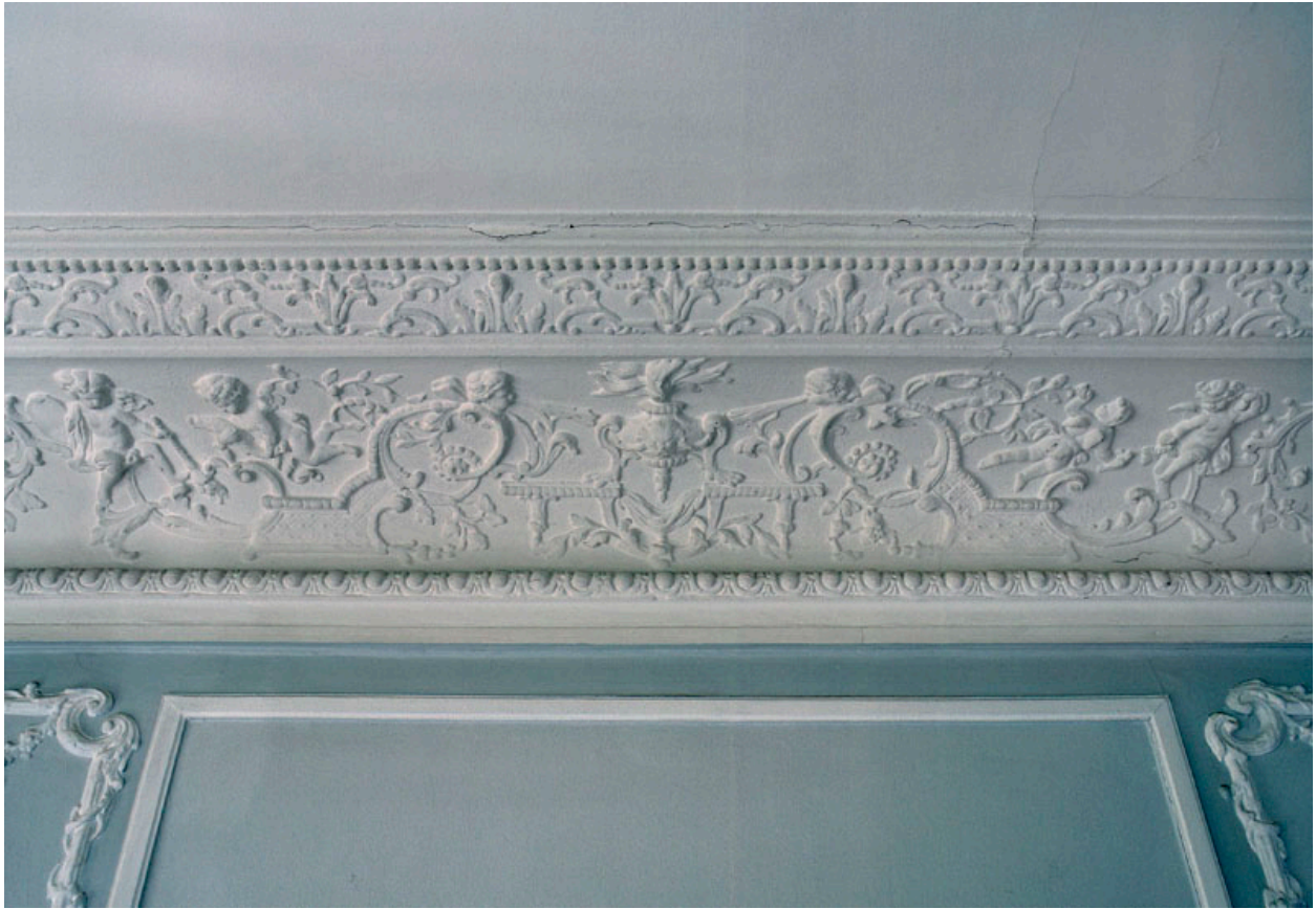
Grand salon : détail de la frise ornée de putti jouant.