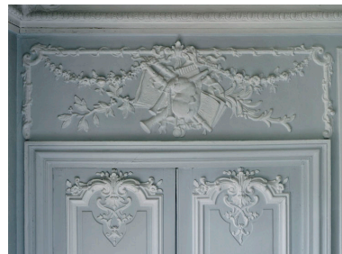
Grand salon : détail des stucs et sculptures en bas relief ornant l'une des doubles portes et le trumeau la surmontant. Instruments de musique disposés en chute et motifs végétaux. IVR11_20069500195XE