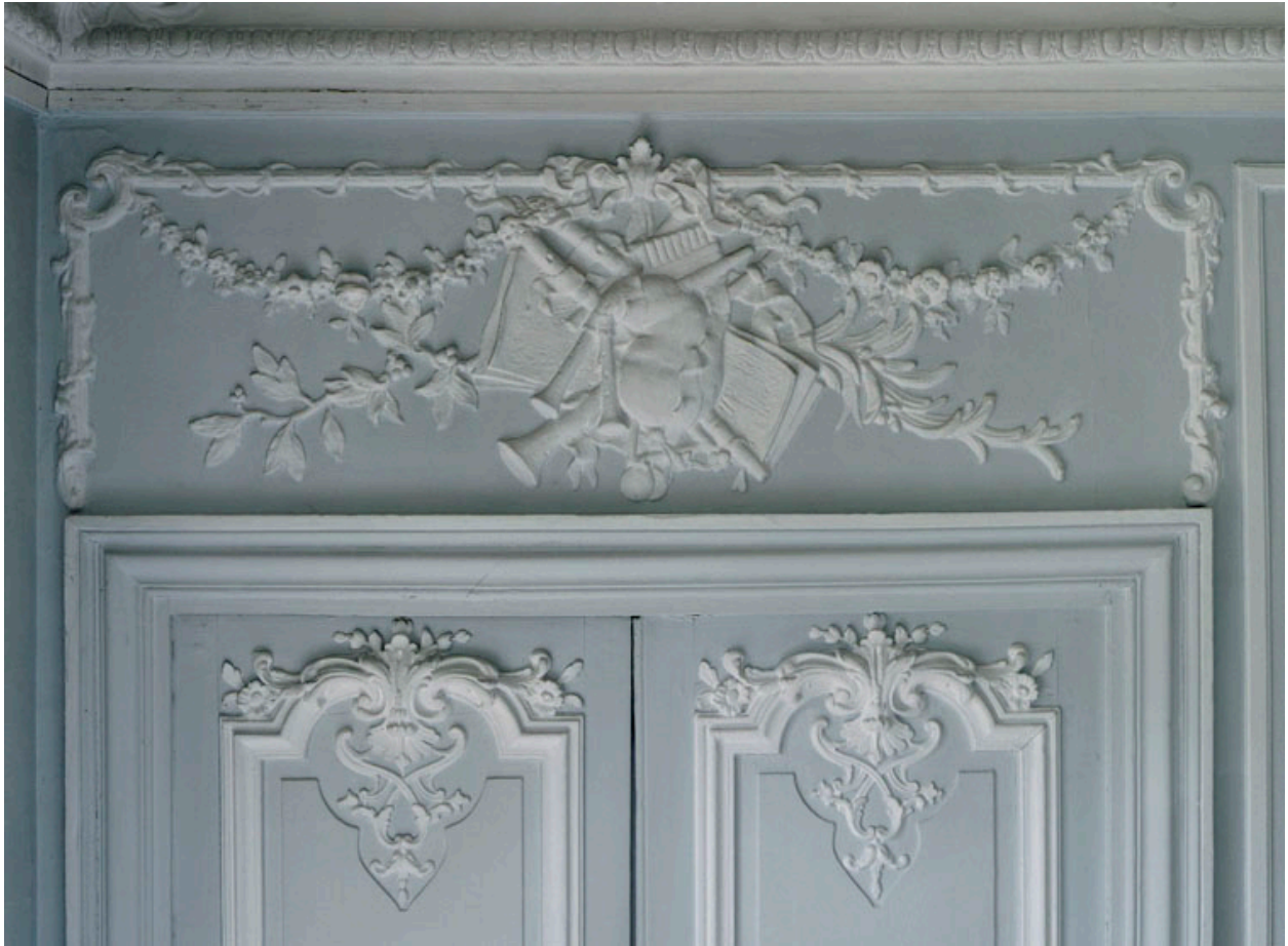
Grand salon : détail des stucs et sculptures en bas relief ornant l'une des doubles porte et le trumeau la surmontant. Instruments de musique disposés en chute et motifs végétaux.