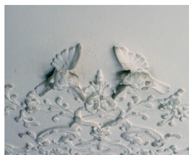
Décor de stuc ornant le milieu du plafond : détail de deux oiseaux volant.