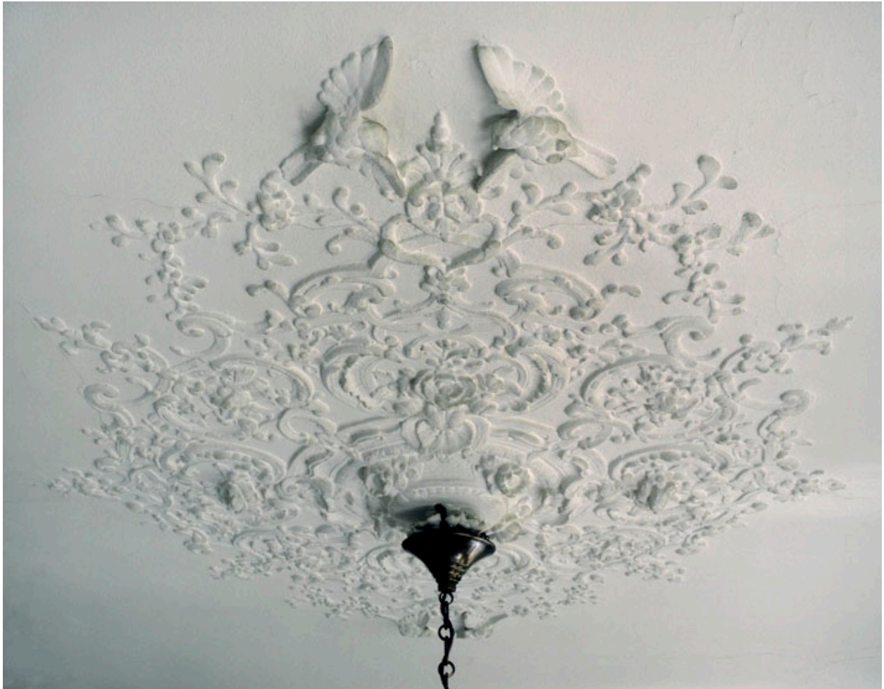
Détail des stucs au centre du plafond, autour de l'attache du lustre.