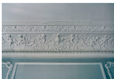
Grand salon : détail de la frise ornée de putti jouant. IVR11_20069500193XE