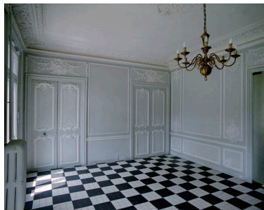
Vue intérieure du grand salon sur jardin. IVR11_20069500190XE