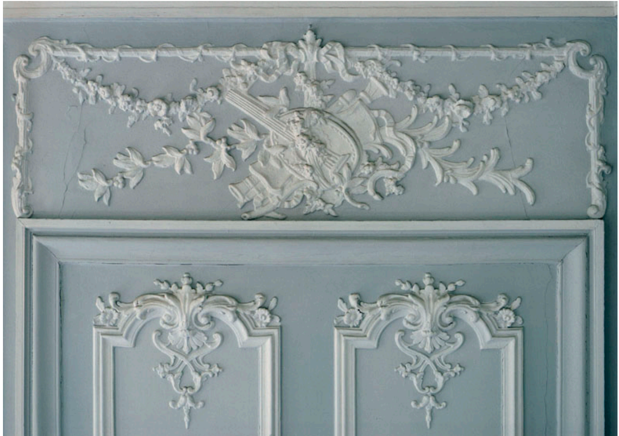
Grand salon : détail des stucs et sculptures en bas relief ornant l'une des doubles porte et le trumeau la surmontant. Instruments de musique disposés en chute et motifs végétaux.