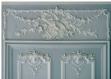
Grand salon : détail des stucs et sculptures en bas relief ornant l'une des doubles portes et le trumeau la surmontant. Instruments de musique disposés en chute et motifs végétaux.