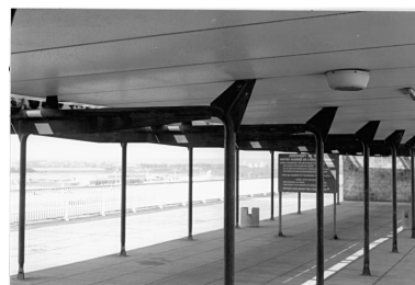
1992, auvent dessiné par Jean Prouvé, la charpente des portiques en tube d'acier porte la toiture en bacs d'aluminium qui repose sur des goussets, 6ème étage Autr. Jean (architecte) Prouvé IVR11_19929400765X