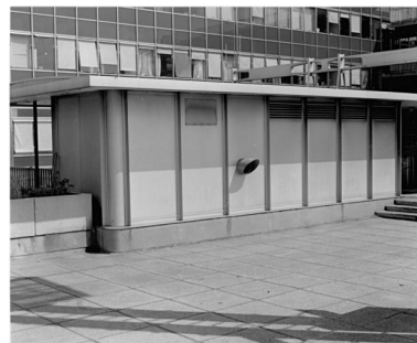
1992, abri, terrasse de la jetée ouest, 4ème étage.