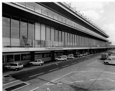
1992, Orly-Sud coté piste, vue prise depuis le sud est.