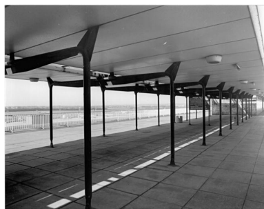
1992, auvent dessiné par Jean Prouvé, 6ème étage. Autr. Jean (architecte) Prouvé IVR11_19929400762X