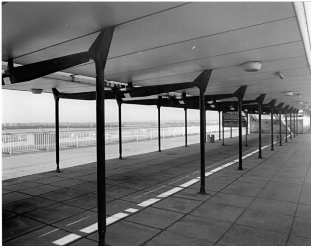
1992, auvent dessiné par Jean Prouvé, 6ème étage.