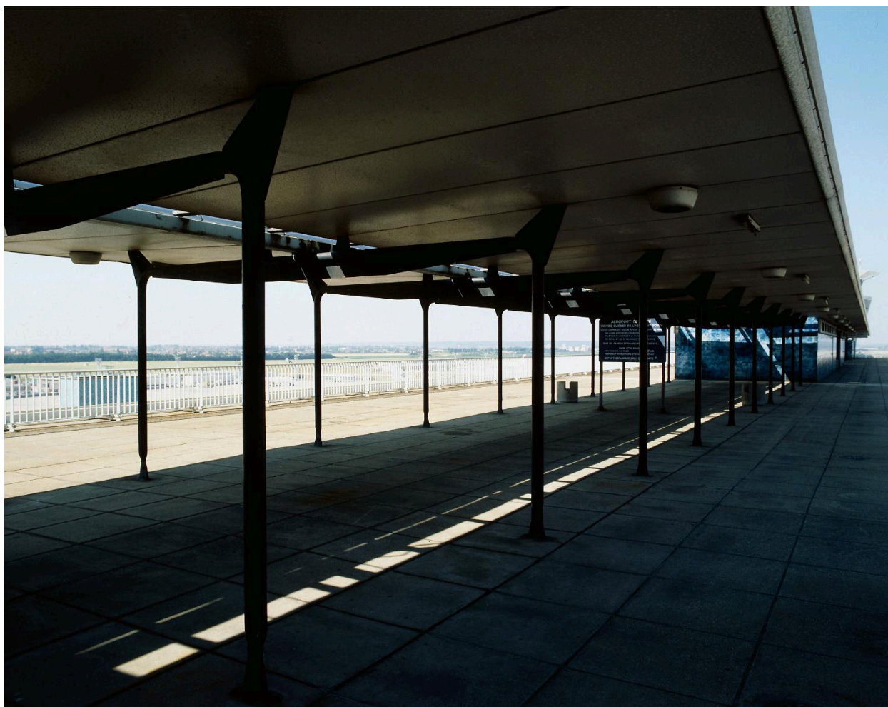
1992, auvent dessiné par Jean Prouvé, 6ème étage.