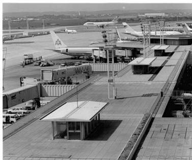
1992, terrasse de la jetée ouest, 4ème étage.