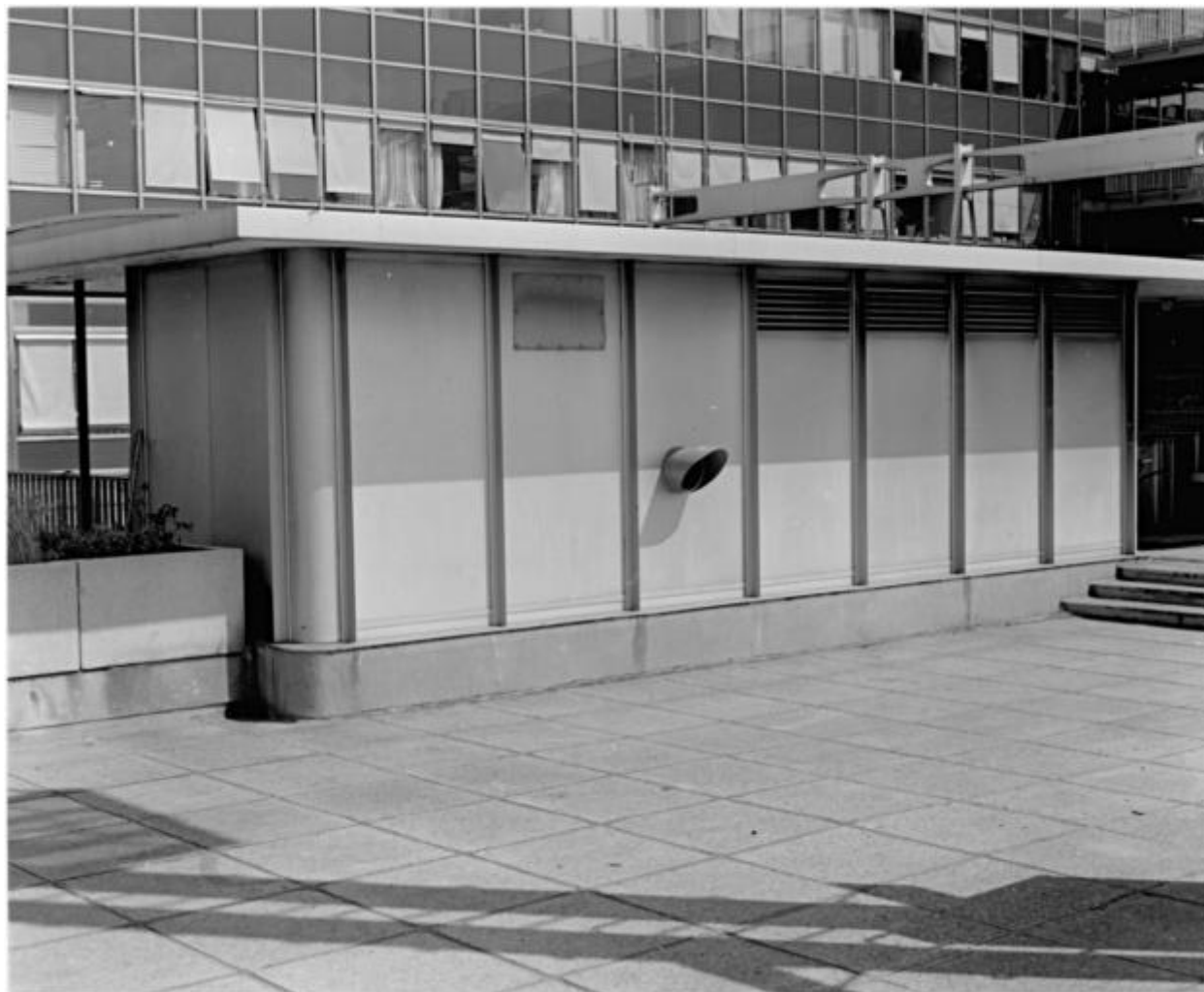
1992, abri, terrasse de la jetée ouest, 4ème étage.