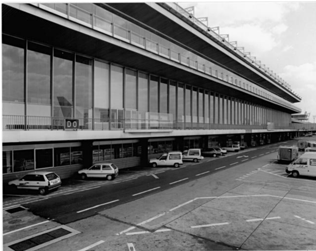
1992, Orly-Sud coté piste, vue prise depuis le sud est.