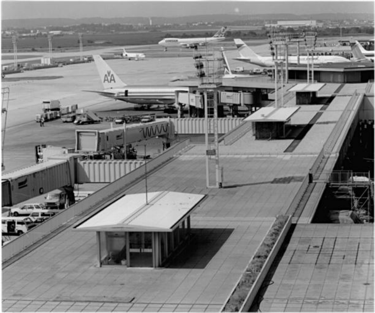
1992, terrasse de la jetée ouest, 4ème étage.