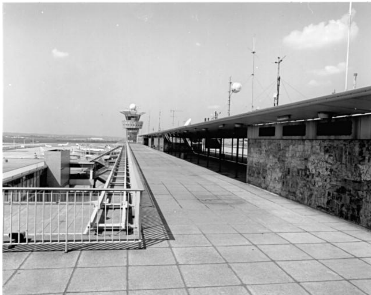
1992, auvent dessiné par Jean Prouvé avec un décor de carreaux émaillés dessinés par Claude Viseux, 6ème étage.