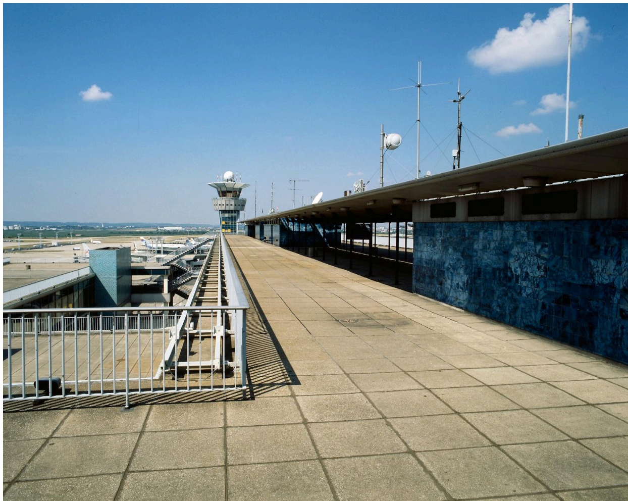
1992, auvent dessiné par Jean Prouvé avec un décor de carreaux émaillés dessinés par Claude Viseux, 6ème étage.