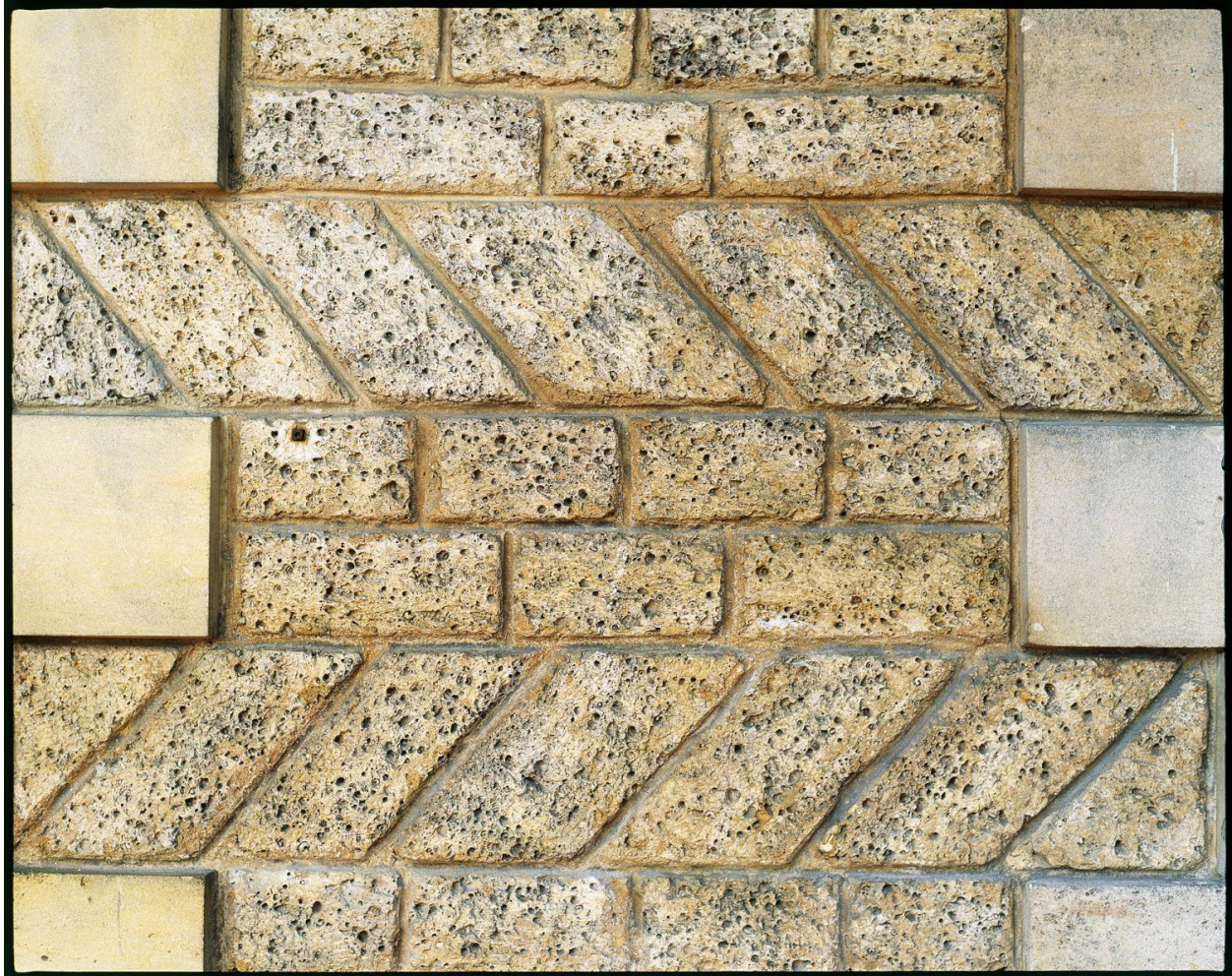
Le ""Château"". détail de soubassement : appareil de meulière à alternance d'assises régulières et en épis.