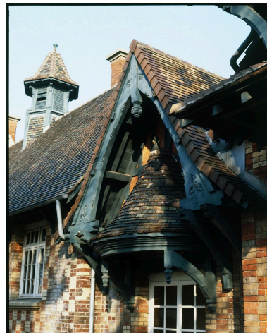
Le "château". Façade antérieure sur cour. Détail d'un auvent. IVR11_19879200209XA