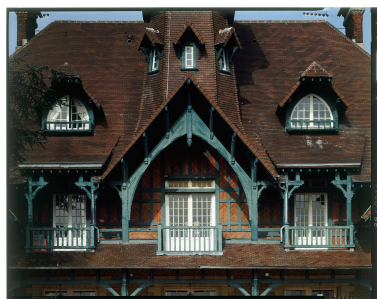
Le "Château". Façade postérieure sur le champ de courses. Détail de la travée centrale.