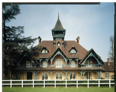
Le "Château". Façade postérieure sur le champ de courses. Vue depuis la piste.