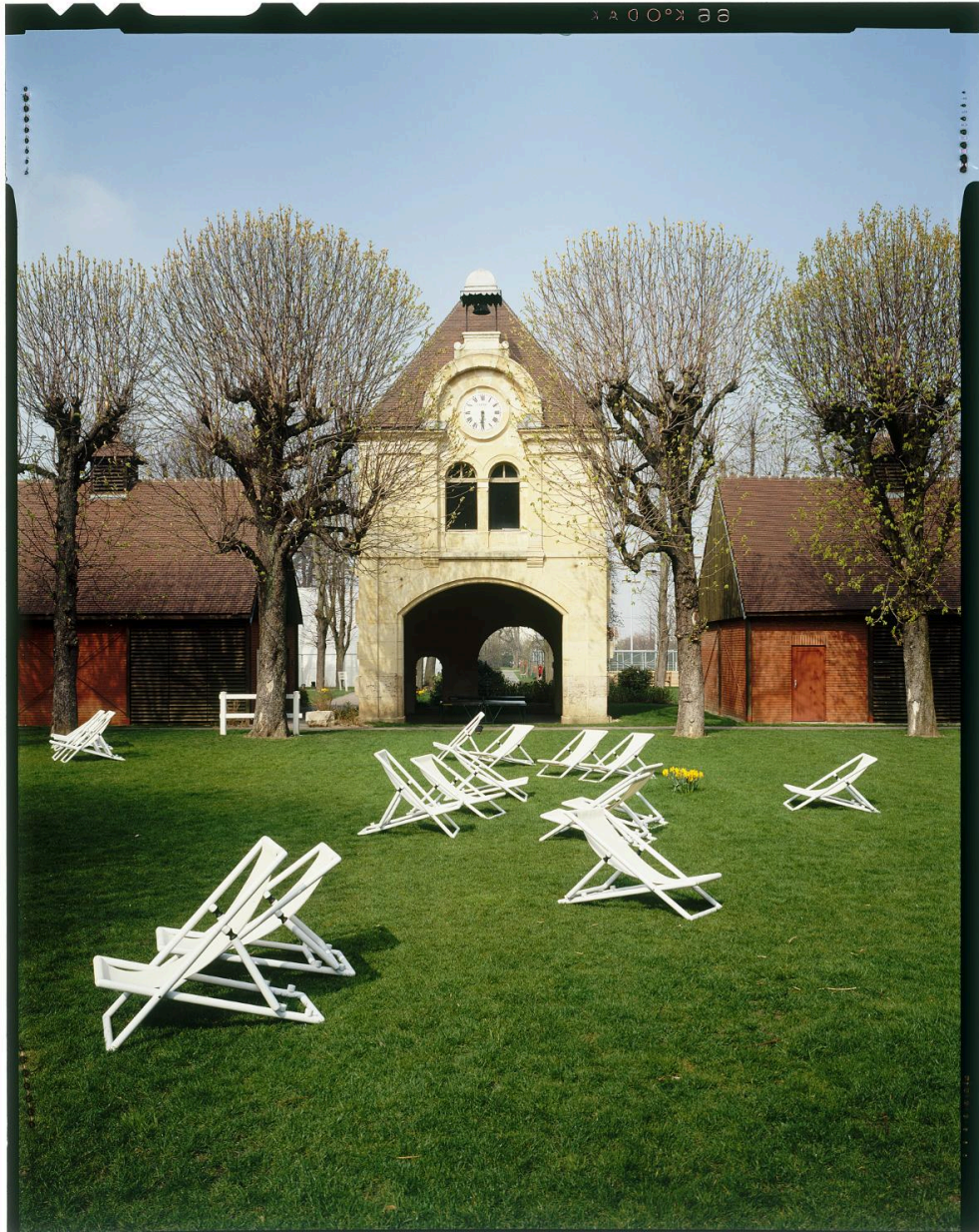
Vue du portail du ""Château de Grande Fouilleuse"".