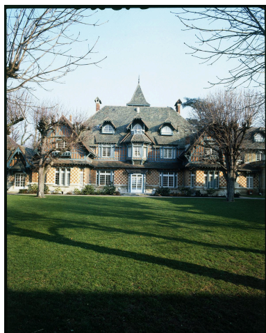
Le "'château'". Façade antérieure sur cour. IVR11_19879200212XA