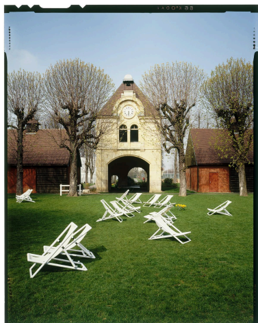
Vue du portail du "Château de Grande Fouilleuse".