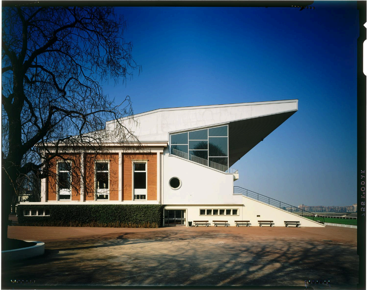
Tribune du pesage, façade latérale.