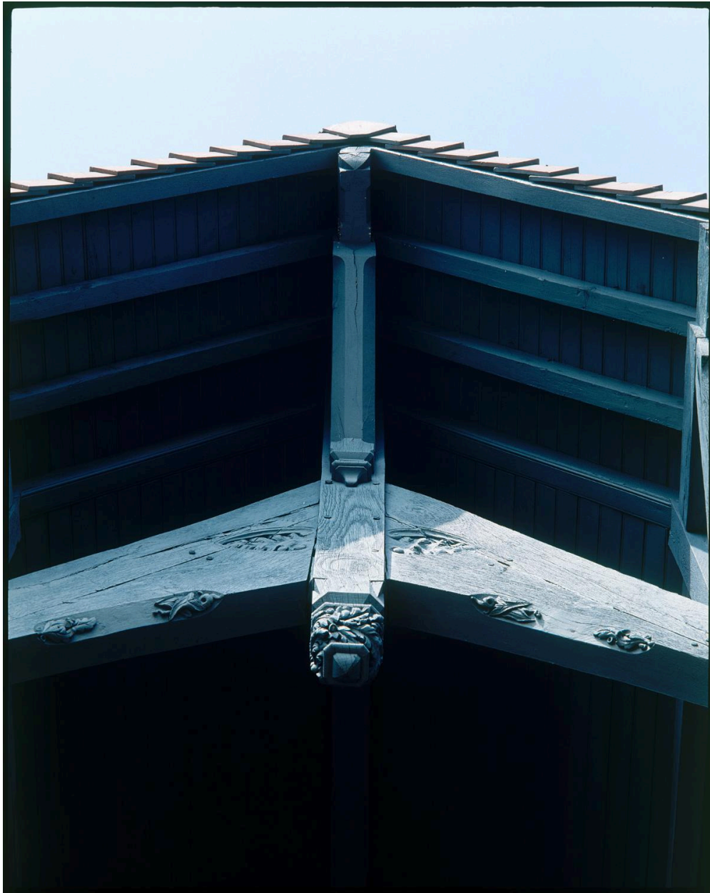
Le ""Château"". Détail de la façade postérieure sur le champ de courses : poinçon pendant de la ferme débordante de la travée centrale.