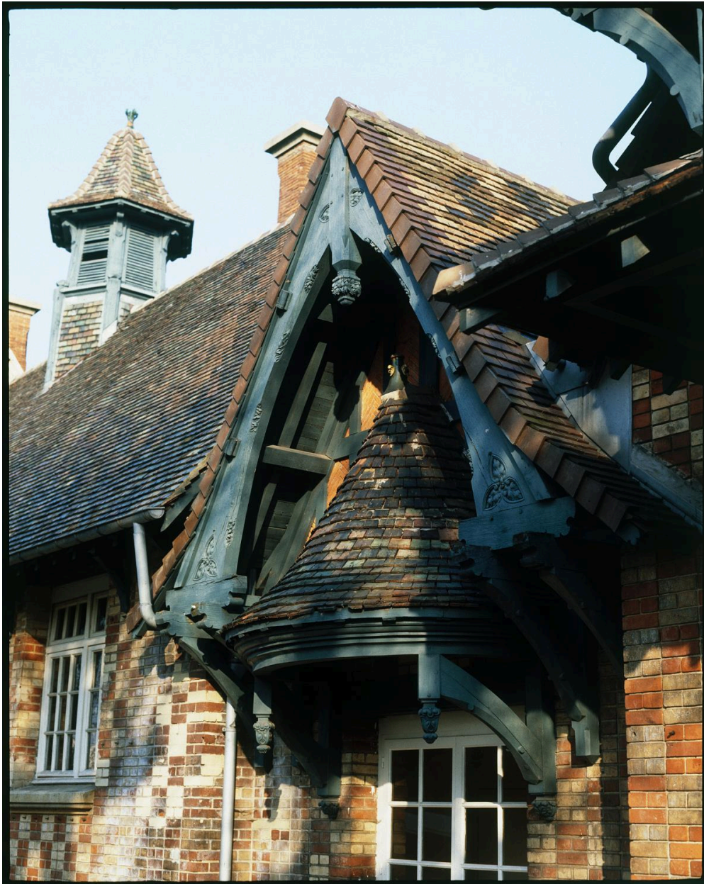
Le ""chateau"". Façade antérieure sur cour. Détail d'un auvent.