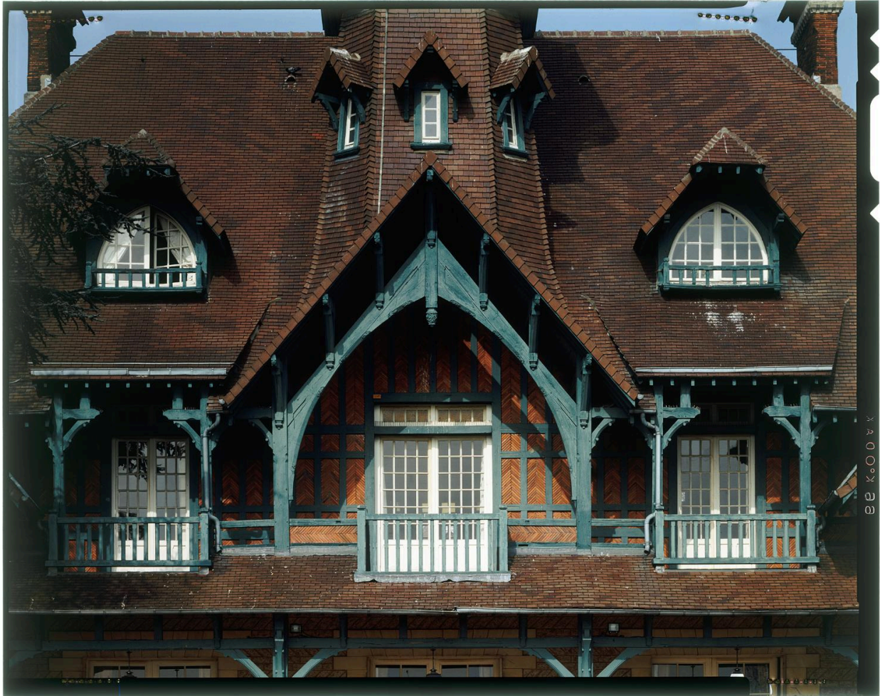
Le "Chateau". Façade postérieure sur le champ de courses. Détail de la travée centrale.