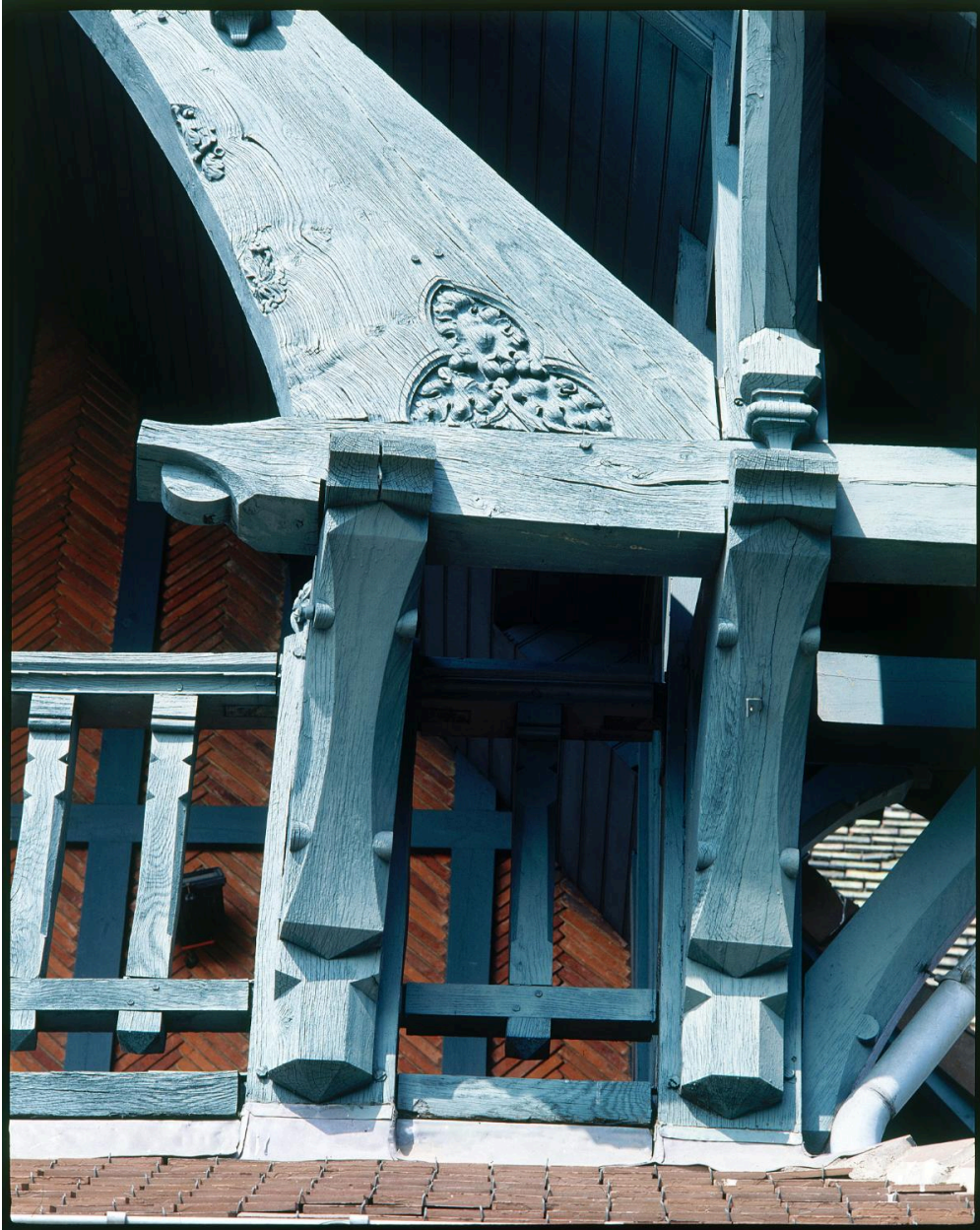
Le ""Château"". Détail de la façade postérieure sur champ de courses, ferme débordante de la travée latérale : aisselier, blochet, et base de l'arbaletrier.