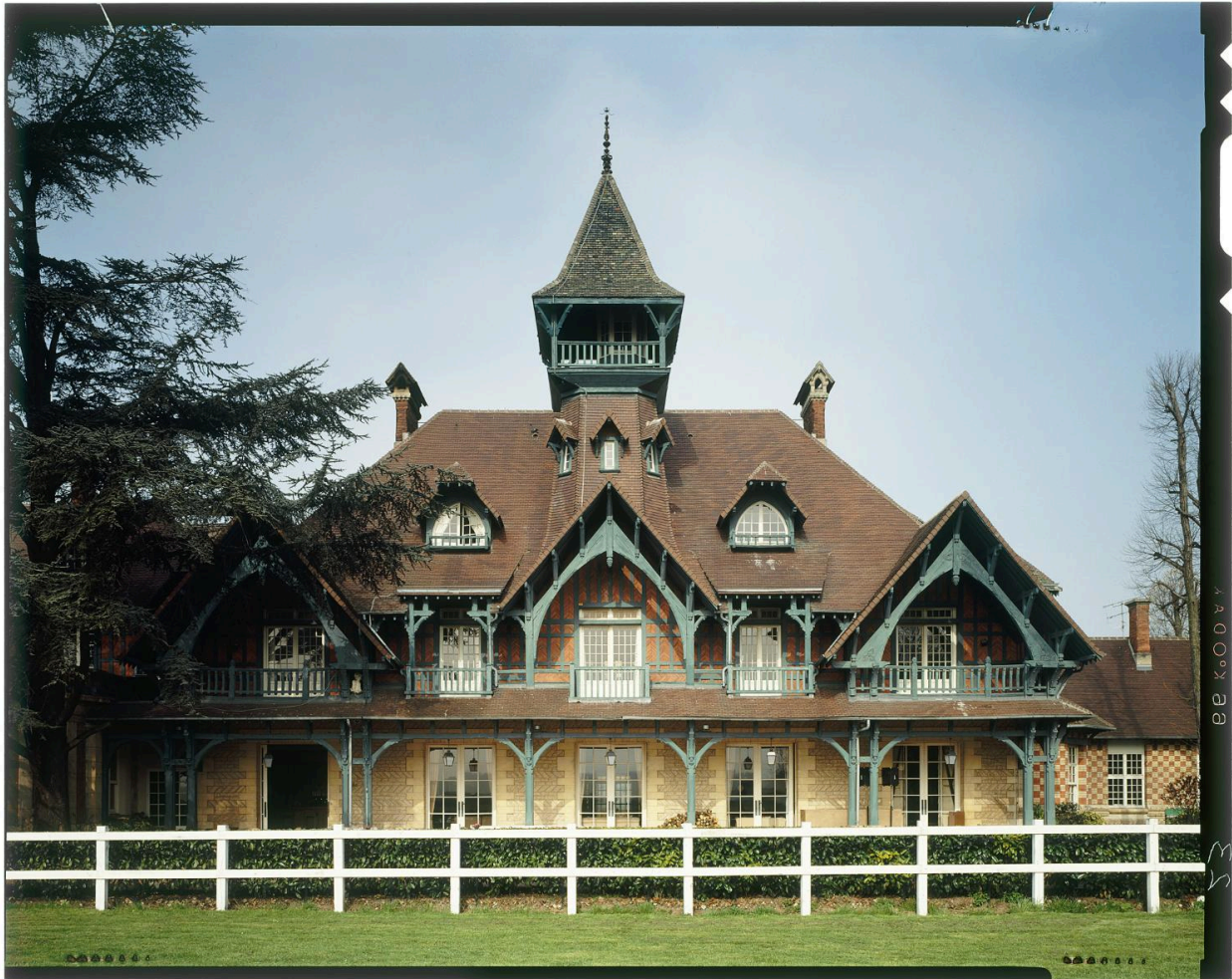
Le ""Chateau"". Façade postérieure sur le champ de courses. Vue depuis la piste.