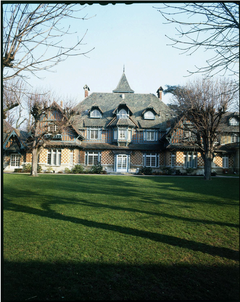
Le ""chateau"". Façade antérieure sur cour.