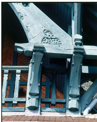
Le "'Château'". Détail de la façade postérieure sur champ de courses, ferme débordante de la travée latérale : aisselier, blochet, et base de l'arbalétrier.