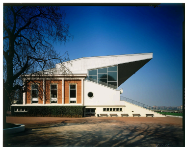
Tribune du pesage, façade latérale. IVR11_19879200191VA